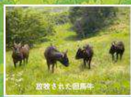
放牧された但馬牛