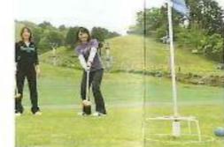
グラウンドゴルフ

素ソリ遊びをはじめ、グ ラウンドゴルフやテニス などさまざまな高気遊び が楽しめます。