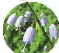
ツリガネニンジン